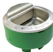
690837-1 Bigcho 2 med svømmer elopvarmet 50W/24V