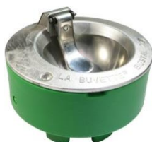
690859 Bigstal 2 med muleklap elopvarmet 50W/24V