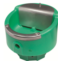
690929 Lakcho 2 med termostat elopvarmet 180W/24V med svømmer