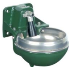
690826 F130-EL elopvarmet 1/2" 30W/24V