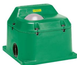
690834 Termolac 40 med 1 bold frostsikret