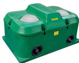
690835 Termolac 75 med 2 bolde frostsikret