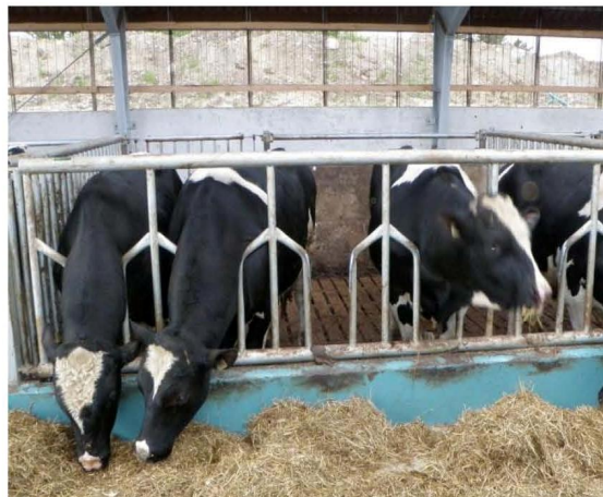
Kirkestolslåge til alle størrelser dyr.