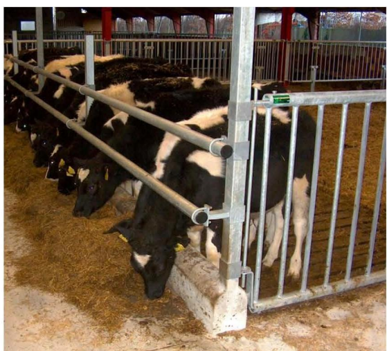
Langsgående æderør ved kalve.