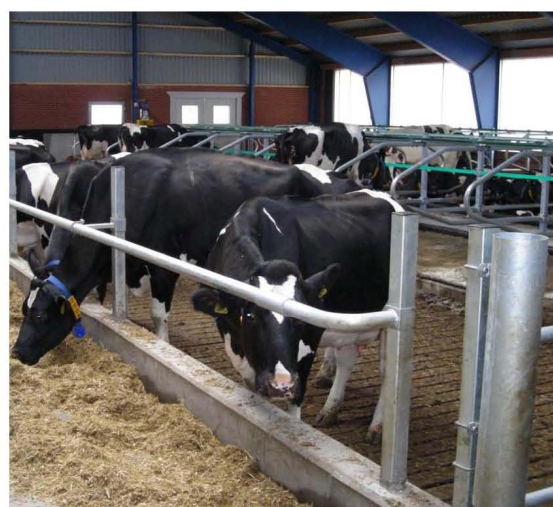
Fremskudt æderør, støvlevask og mandehul.