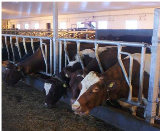
Skrågitterlåge til alle størrelser dyr.