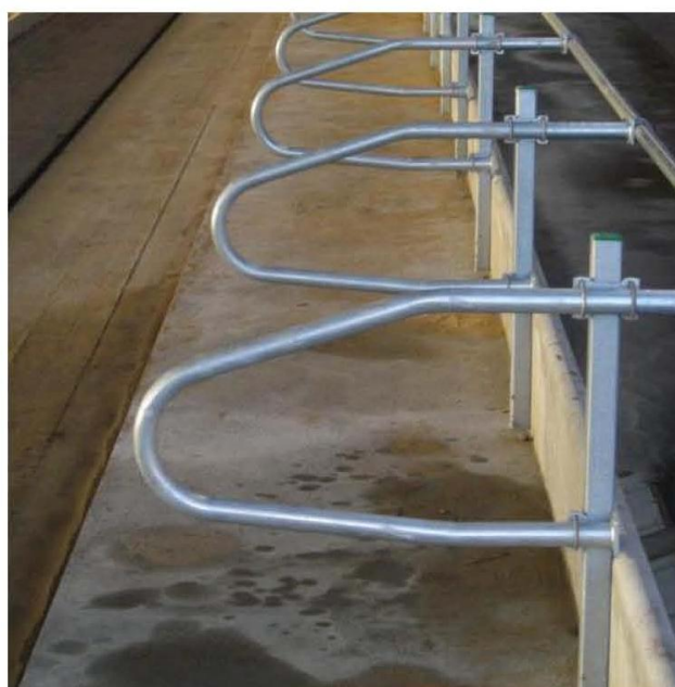
Foderbøjler monteret ved fremskudt æderør.

Der kan monteres bøjler mellem hver ko. Vi har, i samarbejde med flere landmænd, forsøgt i gang med bøjler kun ved hver anden ko og hver fjerde ko.