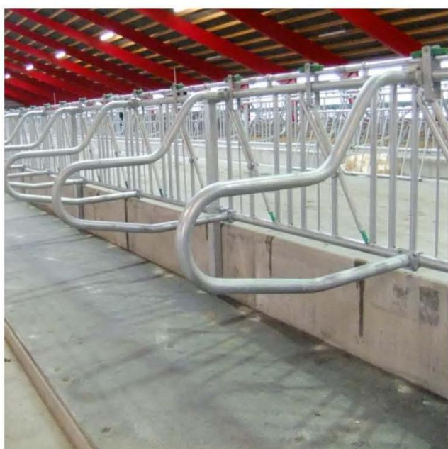
Foderbøjler monteret på fanggitter.